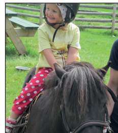
Gøy for barn